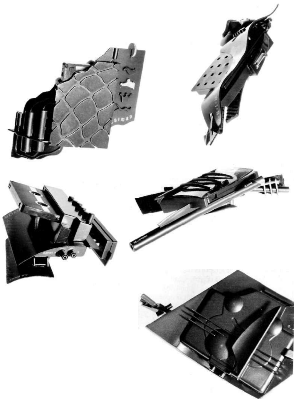
METAmoderne, estudios para un walkman "New Flags for a Future Society" 1988